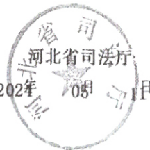
律师事务所变更登记（八）